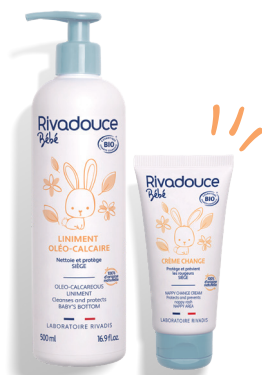
Change Peaux normales (PAGE 5)

Une gamme complète, à chaque couleur : un besoin