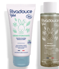
Soin Peaux normales (PAGE 8)