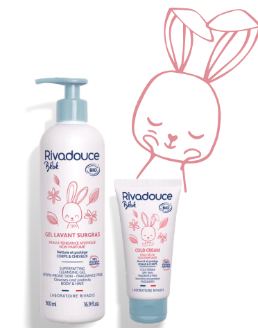
Hygiène et soin Peaux sèches ou à tendance atopique (PAGE 9)