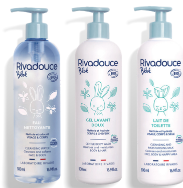
Hygiène Peaux normales (PAGE 6)