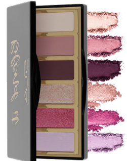
48012 PALETTE BLEND IT 2 CHARMING HARMONY