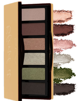
48011 PALETTE BLEND IT 1 SPARKLE PARTY